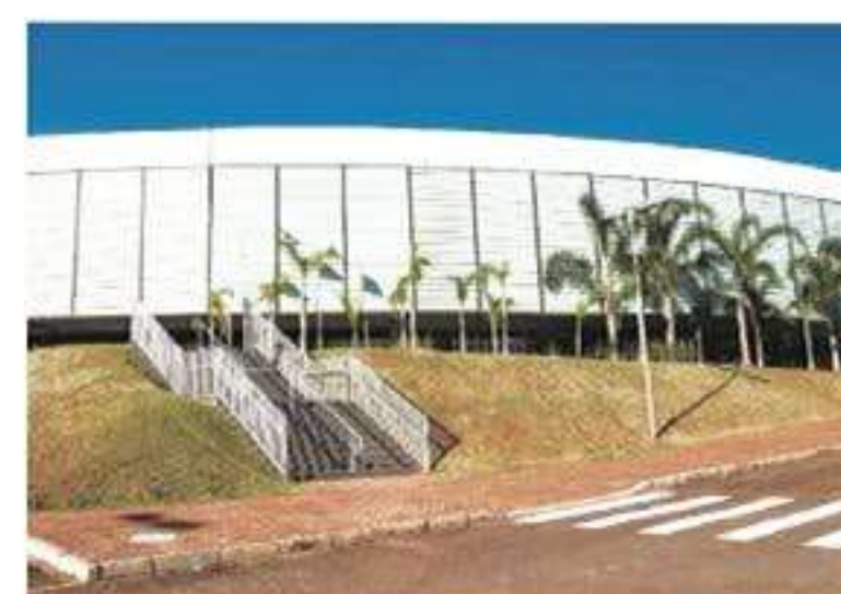
Ensino fundamental ao médio: