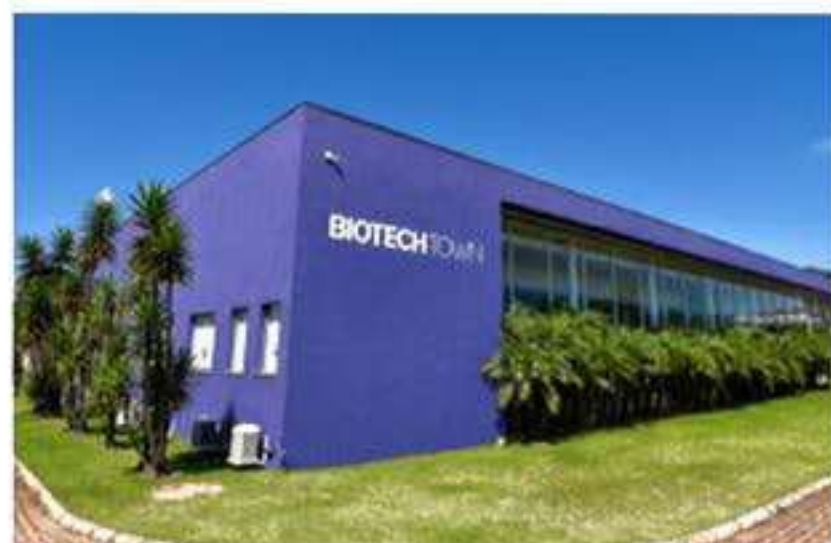
Pesquisa e desenvolvimento:

Fundação Dom Cabral: eleita a melhor escola de negócios da América Latina e a 9ª melhor do mundo, segundo ranking do Financial Times.