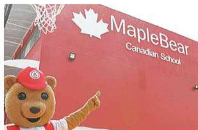
Educação infantil bilíngue: